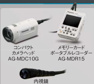
コンパクト カメラヘッド AG-MDC10G