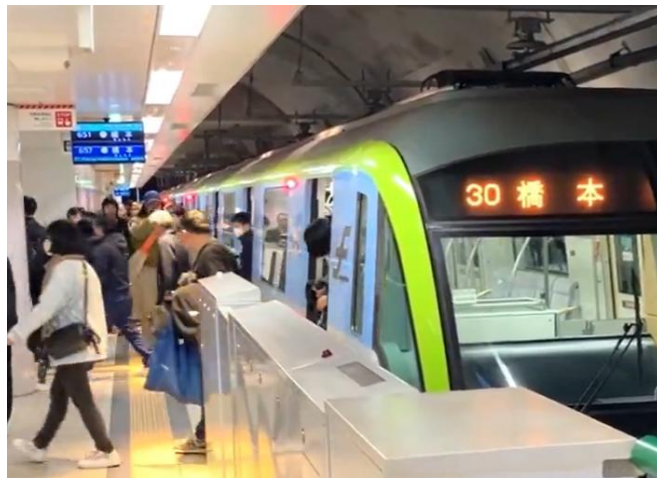
福岡市地下鉄博多駅は1日約10万人が利用する一大ターミナル。福岡市全体の経済活動を支える重要な拠点です。