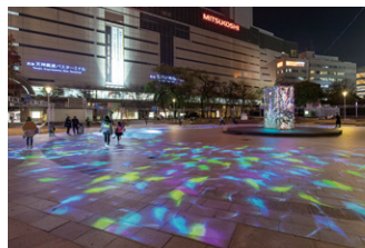
▲ 水の波紋にあわせて、魚のモチーフを採用。色とりどりの魚の群れが自由に泳いでいるよう。