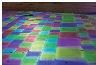
▲ カラフルな映像も、石畳の目地ときれいに揃っている。