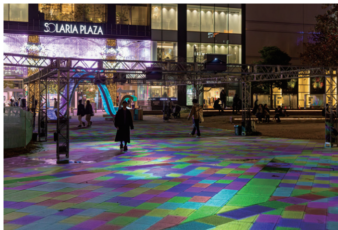
▲ 隣接する施設のLED電飾にも負けず、床面に投写された映像はきれいな発色。