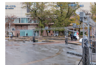
▲ 公園の規定や工期の都合で、大きな足場を組まず、高さ2.5mのトラスを設計。短焦点プロジェクターを複数台使用することで広い投映面を確保した。