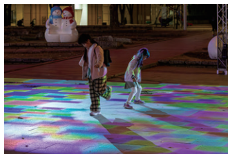
▲ 歩くと色が変わるので、何度も踏んで楽しむことができる。