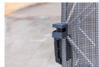
▲ センサー(他社製)で、広範囲なインタラクティブ性を実現。