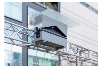
▲ プロジェクターの排熱を考慮して、吸排気ファンを装備。ポリカーボネート製の屋根も備えている。