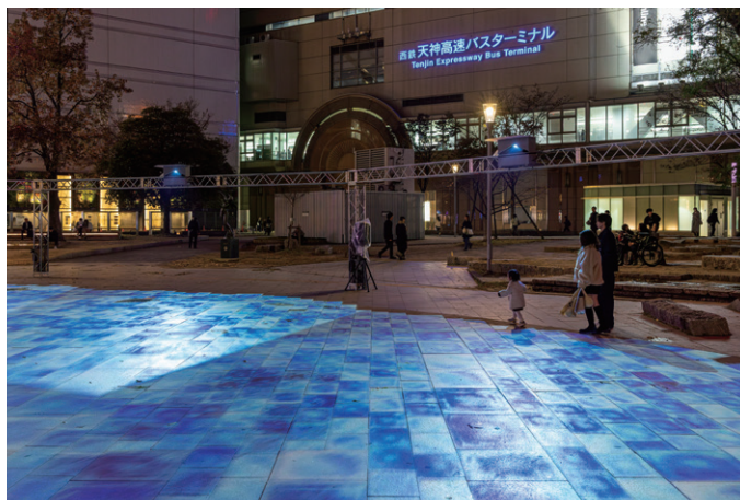
▲ 投写映像と公園の石畳の目地をできるだけ合わせており、映像が床面に自然に広がって見える。