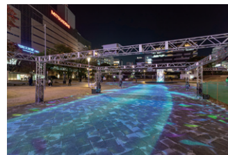
▲ カラフルな魚の群れの上を悠々と泳ぐ大きなクジラ。