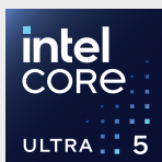
インテル® Core™ Ultra 5プロセッサ

AI専用エンジン「NPU」を搭載したインテル® Core™ Ultra プロセッサ(シリーズ2)搭載。インテル最高水準の電力効率で省電力と処理性能が向上。ローカル上での簡単なAI処理が可能でセキュリティ観点からも安心です。さらにWeb会議時や高負荷作業時快適にお使いいただけます。