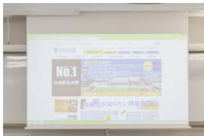
プロジェクターに投影して多人数で情報共有できる