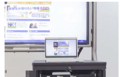
PCなどさまざまな機器を電子黒板に表示できる