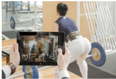
タブレット使いトレーニングルームでフォームを撮影