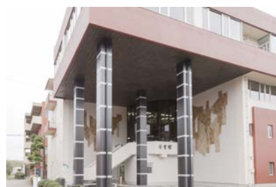
アクティブラーニングルームが新設された図書館