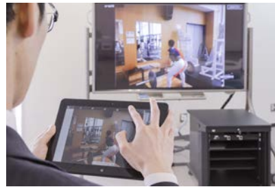
アクティブラーニングルームの電子黒板に画像を転送