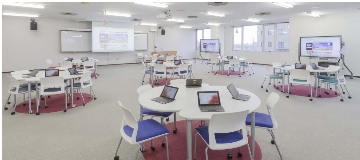
協働学習・アクティブラーニングシステムを導入したアクティブラーニングルーム

2015年に創立50周年を迎える九州共立大学様は、これを機に、学生の協働学習を支援するための仕組みづくりを計画されました。図書館のさらなる利活用を目指し、電子黒板と連携させた協働学習・アクティブラーニングシステムを導入したアクティブラーニングルームを新設されました。