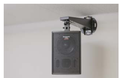
コンパクトスピーカー