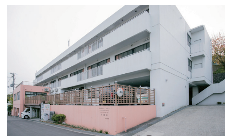
特別養護老人ホーム平尾荘様

外回りの A および B は屋外ハウジング一体型カメラ：WV-SPW311AL を設置。C は利用者に威圧感を与えず受付カウンターも含めて広角に撮影する屋内コンパクトドームカメラ：WV-SFN130。