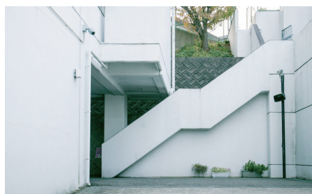
A入口へのスロープと道路を監視