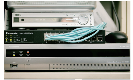
事務室に設定されたネットワークレコーダー