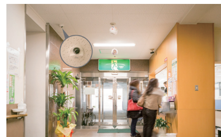
C出入口、受付を広く撮影