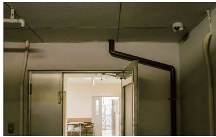
EおよびF非常口と業務用通路外