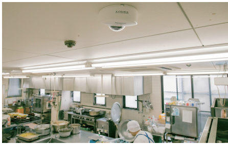
D厨房入口から窓に向かって

計6台のカメラをネットワークディスクレコーダー WJ-NV250/2 に、HD およびフル HD で秒10枚、高画質で1ヶ月弱の映像を記録します。