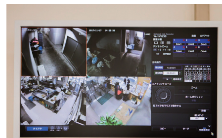
ネットワークレコーダー操作モニター