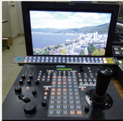
リモートカメラコントローラー AW-RP120Gとカメラ映像を表示するモニター