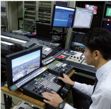
局舎の制作サブなどに設置されたリモートカメラコントローラー AW-RP120Gでカメラ制御が可能