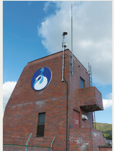
諏訪支局があるビルの上設置されたカメラは諏訪湖を間近に眺望