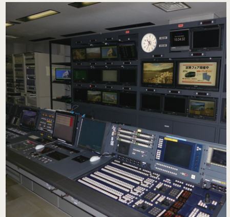
制作サブのモニターに映し出された諏訪拠点の情報カメラ映像

長野朝日放送株式会社様は、長野県内各地に情報カメラを設置し、ニュースや情報番組でのLIVE使用や、災害時に備えた常時収録素材として活用されています。これまではSD画質の情報カメラを使用されていましたが、従来より低価格で高画質な映像を撮影できる情報カメラの導入を検討、2017年2月からこれまでに、4KインテグレートドカメラAW-UE70Kを4台採用されました。AW-UE70KのIP出力機能を活用し、県内各地で撮影された映像を公衆ネットワーク回線で伝送するシステムを構築。長野県内各地の情報カメラのすべての映像を本社に伝送することが可能になりました。さらにカメラ制御はIP接続が可能なりモートカメラコントローラーAW-RP120Gを採用。IPネットワークを活用したシンプルなシステム構成で、効率的な高画質映像の撮影を実現しています。