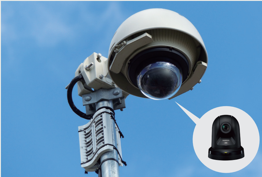
屋内ドームハウジングに格納した4KインテグレートドカメラAW-UE70K