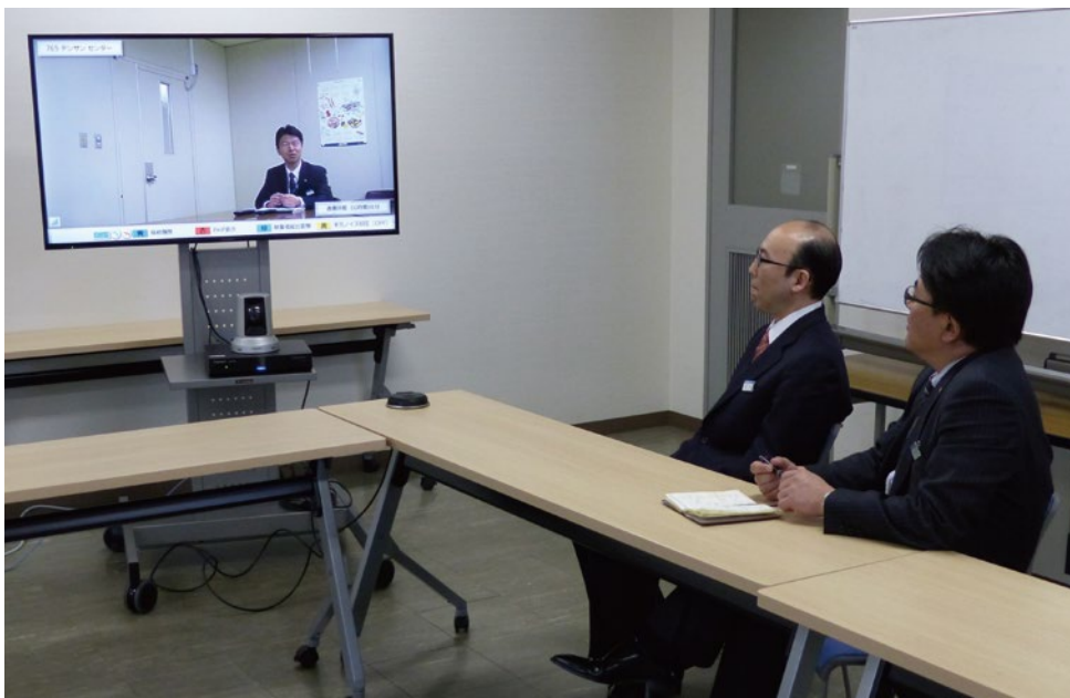
本店の会議室と電算センターをつないで会議を実施