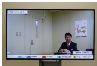
ディスプレイに映る電算センターの映像