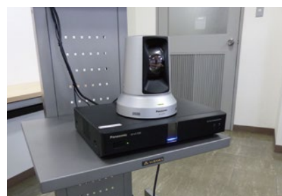
会議室に設置された本体と専用カメラ