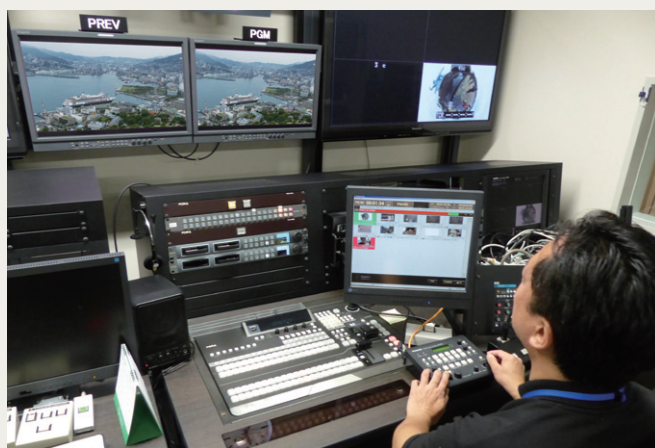
リモートカメラコントローラー AW-RP50を使用して約5km離れた鍋冠山公園展望台のカメラを操作

株式会社長崎ケーブルメディア様は、日本ケーブルテレビ連盟による4K放送専門チャンネル「ケーブル4K」に20以上のコンテンツを提供するなど、4Kコンテンツの制作に積極的に取り組まれています。現在、HDで放送されている長崎ケーブルメディア様のコミュニティチャンネルにおいても、人気コンテンツは4K撮影へ移行を進めており、今後本格化する4K放送に向けた番組制作のワークフローを構築されています。その中で、4K撮影が可能な情報カメラの導入を以前から検討されており、2016年8月に4KインテグレートドカメラAW-UE70Kをご導入いただきました。カメラは長崎市内を眺望する鍋冠山公園展望台に設置されており、長崎港に毎朝寄港するクルーズ客船を眺めることができます。AW-UE70Kの高画質なズーム機能により港口に架かる女神大橋を通過し、入港するクルーズ客船の様子を鮮明に映し出すことができています。操作はサブコントロールルームに導入されたリモートカメラコントローラー AW-RP50で行い、撮影した映像はコミュニティチャンネルの中継だけでなく、24時間のライブ番組として、長崎市内の交通情報カメラと切り替えながら放送されています。家にいながらいつでも長崎市内の様子を知ることができると、視聴者から好評の番組です。