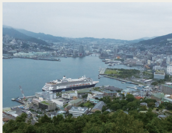
鍋冠山公園展望台から眺望する長崎港