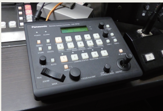
サブコントロールルームに設置されたリモートカメラコントローラー AW-RP50