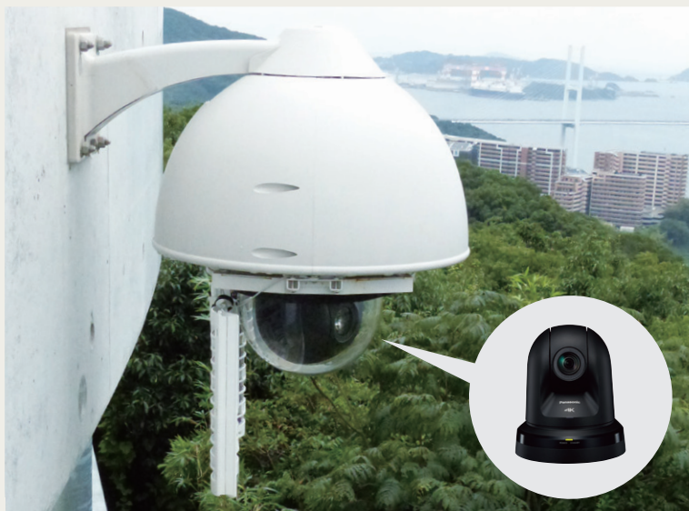
屋外ドームハウジングに格納し、鍋冠山公園展望台に設置されたAW-UE70K