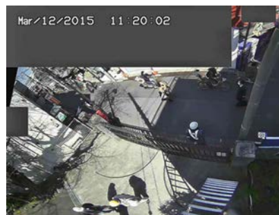
プライバシーゾーンの設定により、地域住民へのプライバシーを保護した監視が可能