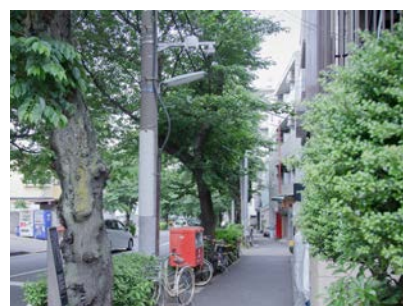
通学路の交差点付近に設置された屋外対応型全方位カメラ

またプライバシーゾーン(※)の設定により、地域住民の方々のプライバシーに配慮した撮影範囲の調整も可能となっています。品川区教育委員会様では残りの 21 校の通学路にも防犯カメラを設置される予定です。