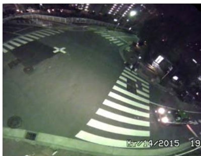
夜間の監視にも対応