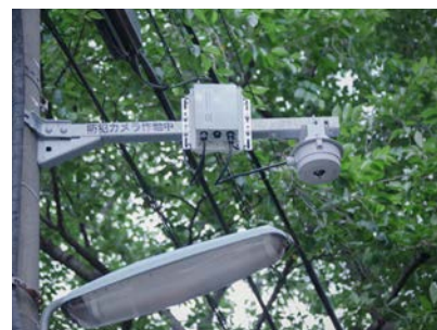
1台のカメラで広いエリアの監視が可能な全方位カメラを採用