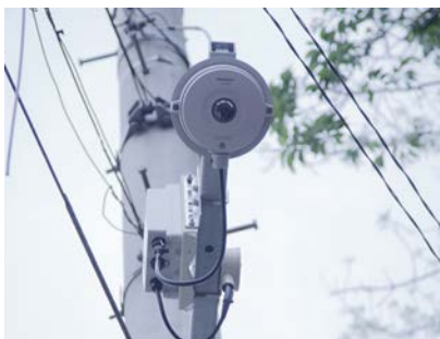
屋外対応型全方位カメラ WV-SW458

※：プライバシーゾーンは撮影場所（画面）の中に写したくない部分がある場合、その部分（プライバシーゾーン）だけを表示しないようにする機能