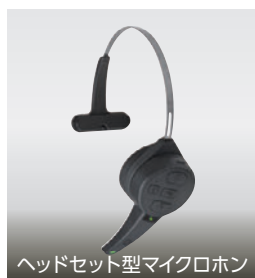
ヘッドセット型マイクロホン