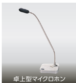
卓上型マイクロホン