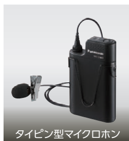
タイピン型マイクロホン