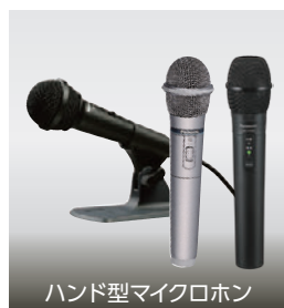
ハンド型マイクロホン