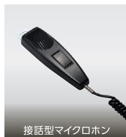
接話型マイクロホン